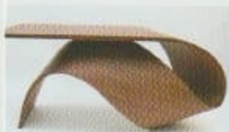
Ci-dessus : bureau Wave, création Pierre Renart. À droite : l'Hôtel Solvay, fruit du talent de Victor Horta et du budget illimité du commanditaire Armand Solvay.

Maison parisienne, Florence Guillier-Bernard, tél : +33 (0)6 20 48 58 96, contact@maisonparisienne.fr, maisonparisienne.fr • Hôtel Solvay, 224 av Louise, 1050 Bruxelles, site : hotelsolvay.be, tél : 02 640 56 45. ■