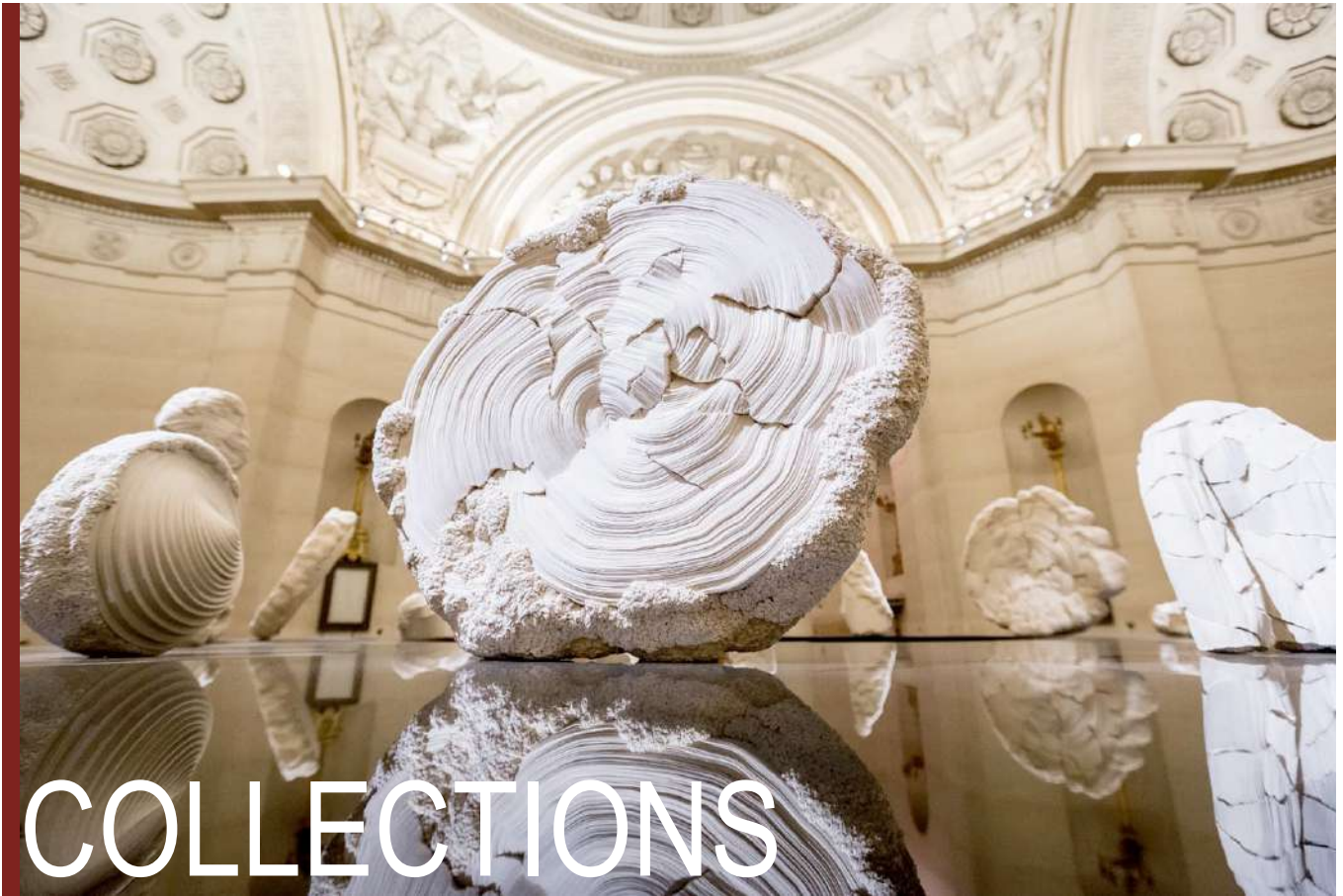
TOURBILLON 13 - 2021