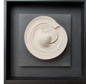
TOURBILLON 17 - 2021

Plis de coton, épingles, encadrement bois Cotton folds, pins, wooden frame 23,5 x 23,5 cm