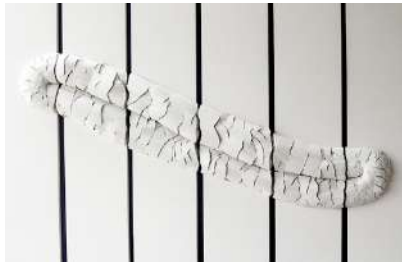
L'ILE - 1995

Plis de coton, épingles Cotton folds, pins H 185 x L 58 cm 6 panneaux/ panels