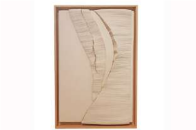
DUNES - 1995

Plis de coton, épingles, encadrement bois Cotton folds, pins, wooden frame 66 x 44 cm