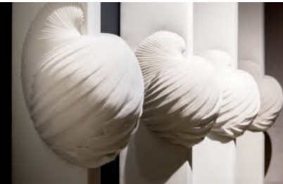
DECADE - 1987

Plis de coton, épingles Cotton folds, pins H 200 x L 30 cm 10 panneaux/ panels