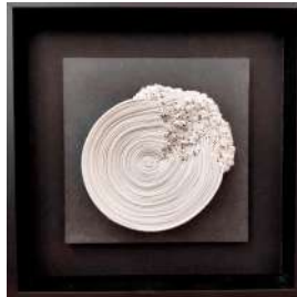
TOURBILLON 14 - 2021

Plis de coton, épingles, encadrement bois Cotton folds, pins, wooden frame 23,5 x 23,5 cm