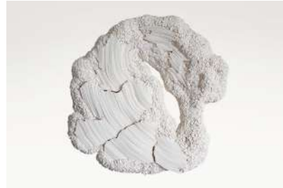
EUGENIE, SERIE ECLIPSE - 2021

Plis de coton, épingles Cotton folds, pins D 38 cm