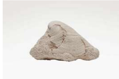
DETAIL VII - 2021

Plis de coton, épingles Cotton folds, pins, 38 x 25 cm