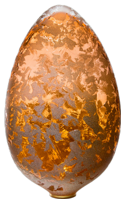
Cristal II, 2022