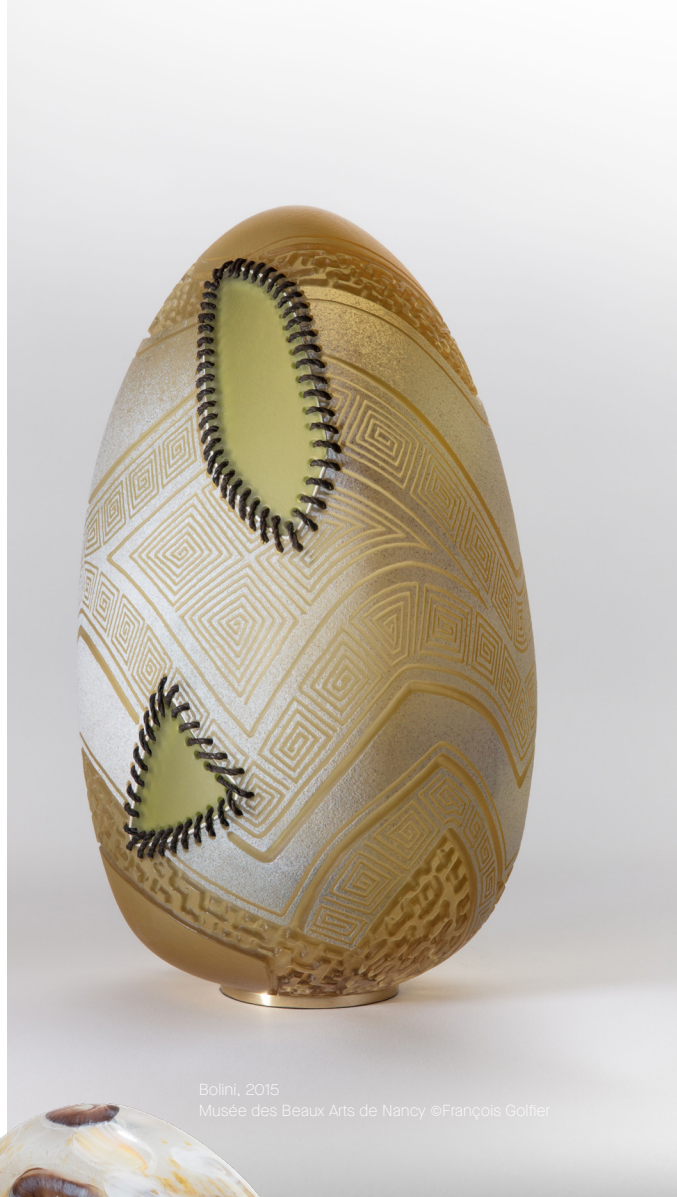
Bolini, 2015 Musée des Beaux Arts de Nancy

La gravure est aussi un médium important. À l'aide d'un micro-outil de graveur, dont il se sert comme d'un crayon, Gérald Vatrin entaille la surface d'une pièce de verre du motif souhaité. Son geste est spontané, instinctif, à la manière des dessins ethniques aucunement maniérés.