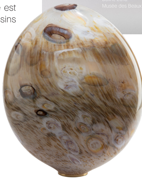
Variations Picturales I, 2023

Toutes uniques, les sculptures multi-texturées révèlent ainsi des jeux d'ombres et de lumières, de brillance et de matité. Certaines peuvent avoir l'apparence de la glace, d'autres de la pierre de lave par exemple. Issues d'un métissage culturel à plus d'un titre, elles expriment avec force des sentiments de calme, d'agitation, de force ou de mesure.