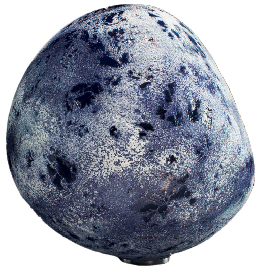
Le Verre vu du ciel XII, 2021

Son travail figure dans de nombreuses institutions publiques – dont le MAD-Musée des Arts décoratifs de Paris, le Musée du Verre de Sars-Poteries en France, le Victoria and Albert Museum de Londres ou le Dutch National Glass Museum de Leedam au Pays-Bas– ainsi que dans plusieurs collections privées, telle la Ernsting Foundation Alter Hof Herding en Allemagne.