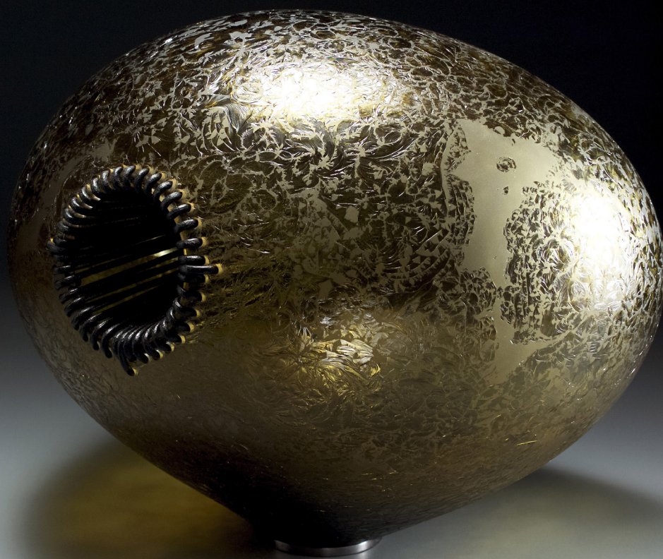
Trait d'union I, 2018, MAD - Musée des Arts Décoratifs Paris ©Amadou Traoré