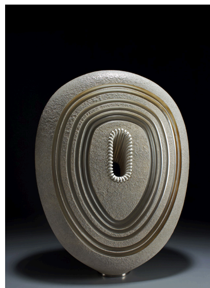
Sable, 2021 ©Amadou Traoré

De nouvelles créations de Gérald Vatrin sont mises en lumière chaque année sur le stand de maison parisienne au PAD Paris et au PAD London. L'artiste a également été sélectionné par la galerie pour participer à son exposition anniversaire, «15 ans, 15 artistes, 15 œuvres» en avril dernier. Il y a présenté Au-delà des apparences , un ensemble exceptionnel de 5 œuvres en verre soufflé réhaussées de feuilles d'or.