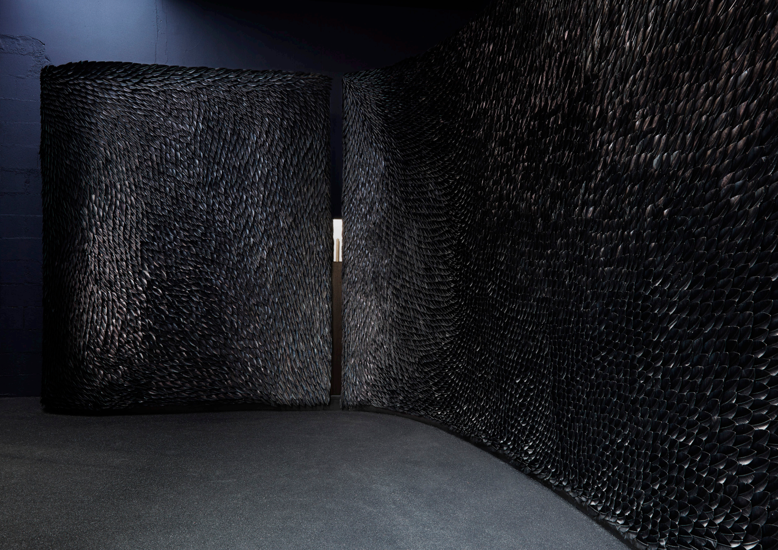
Black Ocean, Palais de Tokyo, 2017