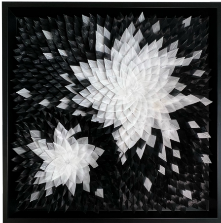
Black Dahlia, 2022 ©maison parisienne