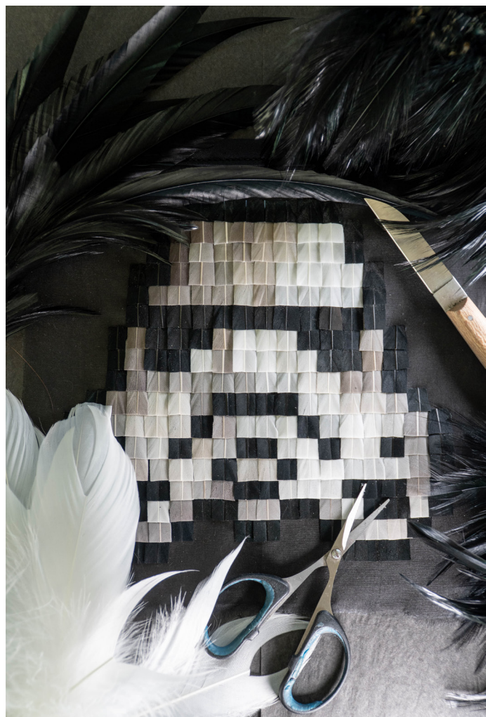
StormTrooper Pixel Art, 2022 ©maison parisienne

Il prête la plume à toutes les audaces en utilisant des outils manuels du passé et d'une grande simplicité : une paire de ciseaux, un couteau à parer, un couteau à friser, une pince brucelles... Sans oublier une seule et unique machine, destinée à faire de la vapeur et datant de l'époque napoléonienne !