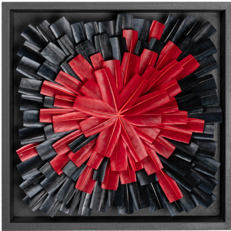
Nova BR, 2021