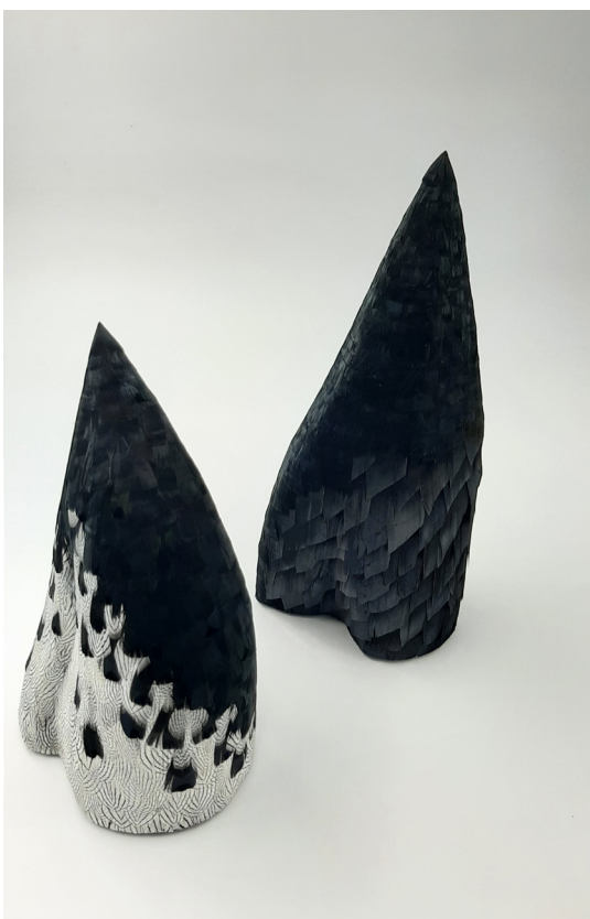
Totem, 2021