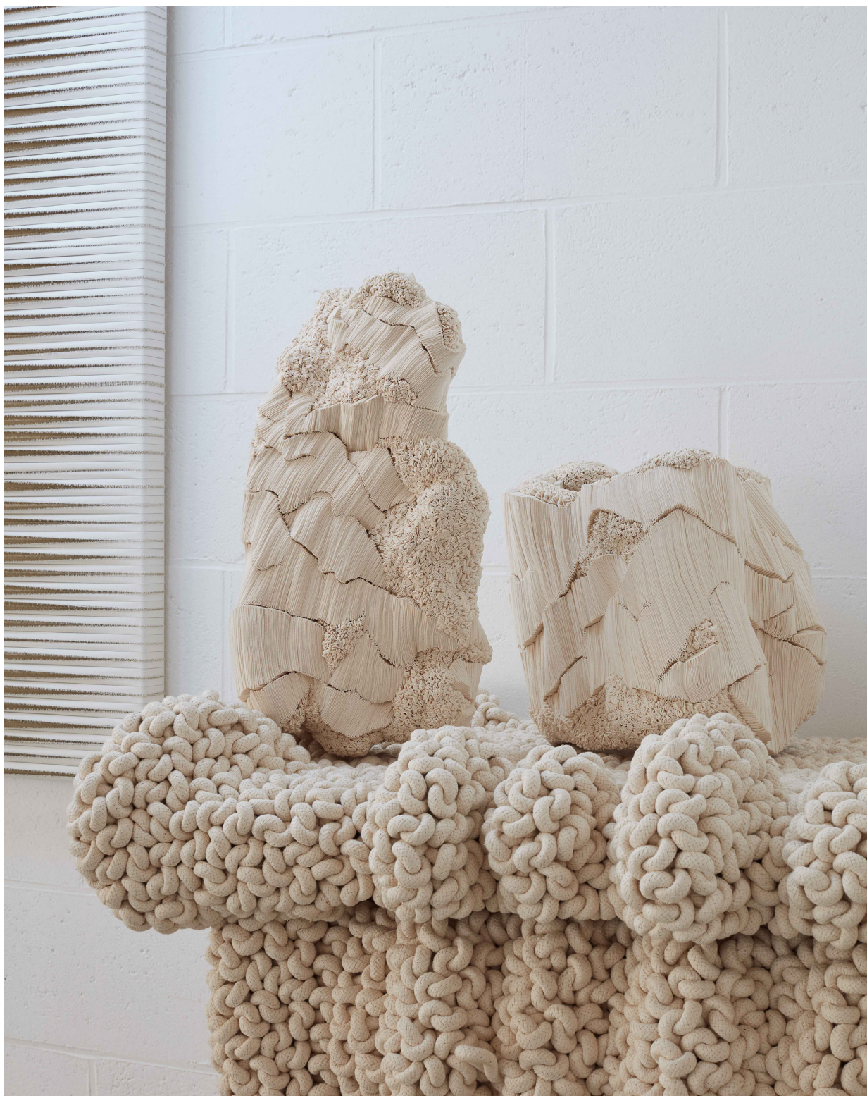
Falaise I, 2012 et Anfractuosité I, 2013 ©Antoine Lippens