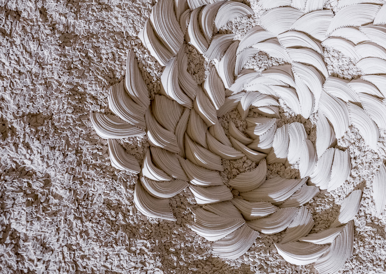
Écllosion XXL, 2017 © maison parisienne