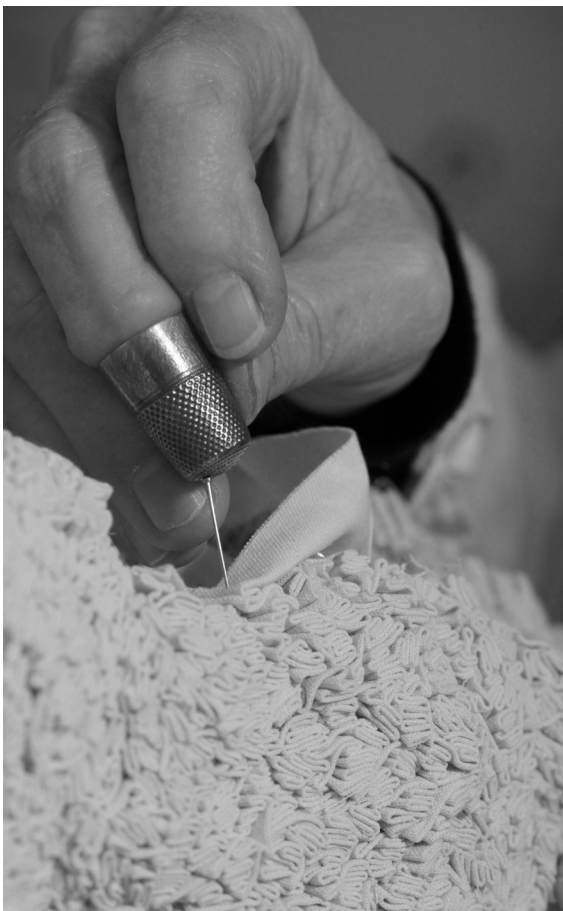
Simone Pheulpin © Sophie Bassouls