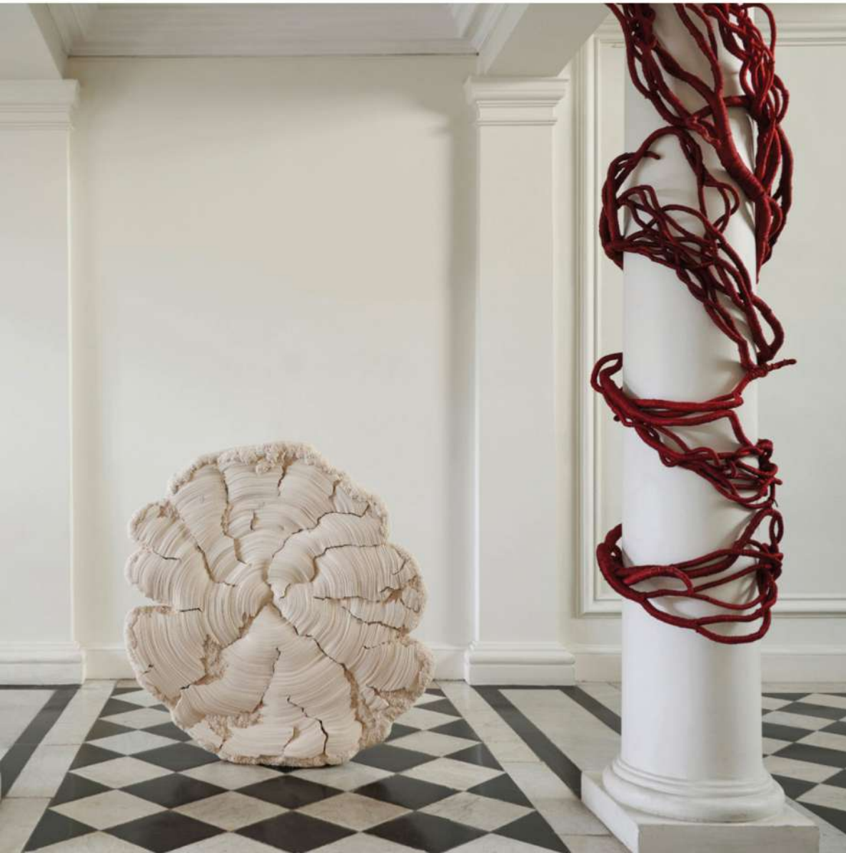
← ↑ Du 2 au 9 avril 2024, le Hall des Maréchaux, au musée des Arts décoratifs de Paris, à accueilli « 15 ans, 15 artistes, 15 œuvres », l'exposition anniversaire de Maison parisienne.