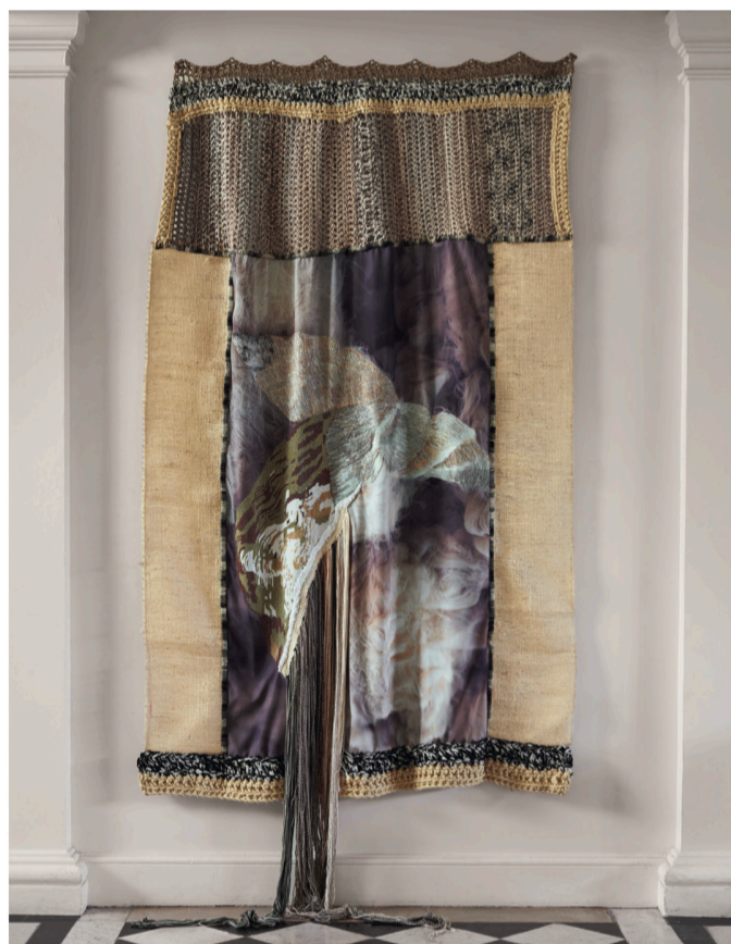
photographie rebrodée, laine et fils de raffia embroidered photograph, wool and raffia H. 235 L. 175 cm