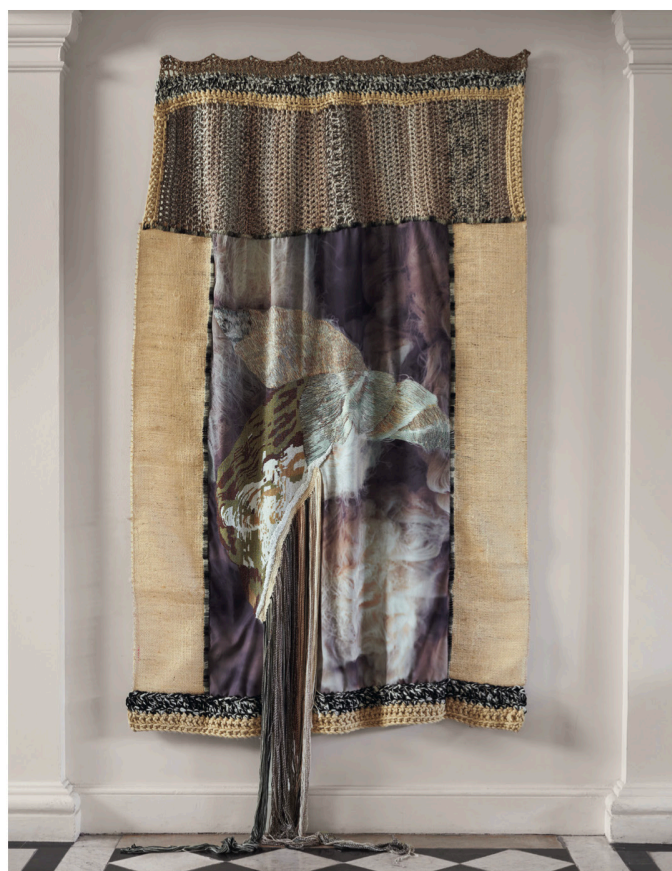
photographie rebrodée, laine et fils de raphia embroidered photograph, wool and raffia H. 235 L. 175 cm