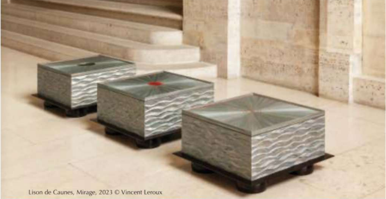
Lison de Caunes, Mirage, 2023 © Vincent Leroux