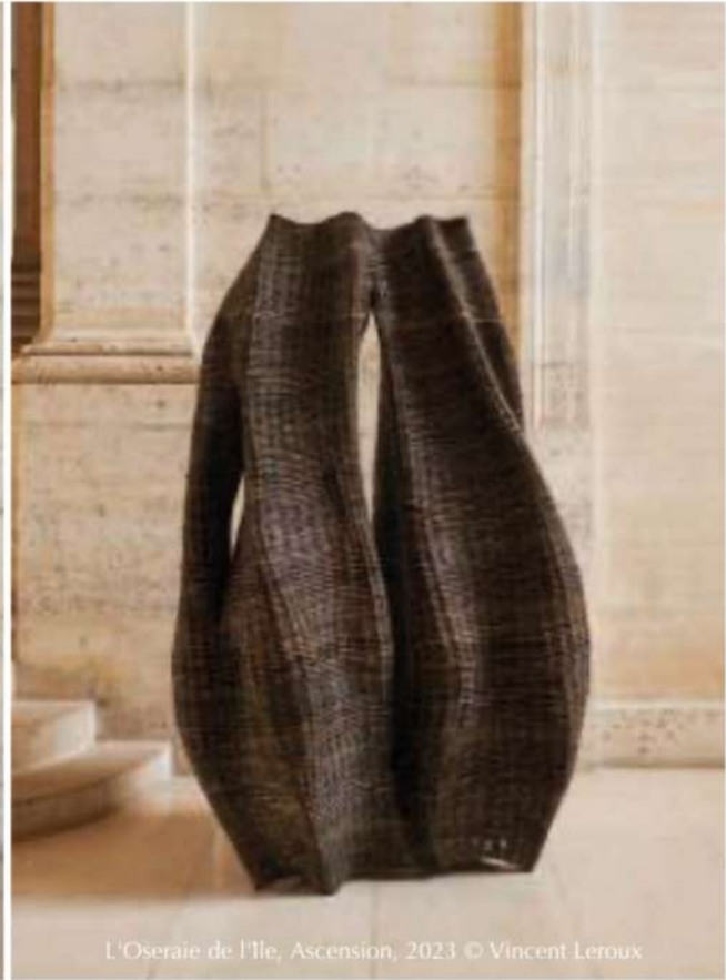
L'Oseraie de l'Ile, Ascension, 2023